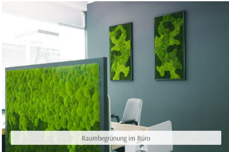
Raumbegrünung im Büro

Wir hoffen Sie haben viel Spaß bei der Gestaltung Ihres persönlichen DIY-Moosbildes! Moosbilder sind in jeglicher Hinsicht ein echter Hingucker! Die Kombination aus pflanzlicher Natürlichkeit und schlichter Eleganz durch unsere hochwertigen Rahmen ist nicht zu übertreffen! Holen auch Sie sich ein erfrischendes "Stück" aus der Natur direkt zu Ihnen nach Hause! Und wenn nicht zu Ihnen nach Hause, dann mit in Ihren beruflichen Alltag, ins Büro! Und auch das ist mit Moos Design wunderbar möglich! Moos Design bietet Ihnen eine große Auswahl von Dekorationen aus Moos in verschiedensten Designs und Moosarten. Sehen Sie sich doch beispielsweise gerne unsere Raumtrenner aus Moos an! Durch das Moos isolieren die Raumtrenner hervorragend Schall und eignen sich so optimal für einen ruhigeren Büroalltag! Sollten Sie sich nun noch für weitere Raumbegrünungen aus z. B. anderen Pflanzen interessieren, schauen Sie doch einfach bei uns im Magazin vorbei! Dort erfahren Sie alles Wissenswerte über pflanzliche Raumdekorationen und Moos! Lassen Sie sich hier außerdem gerne von weiteren Großprojekten von Moos Design, wie beispielsweise Moosbilder mit integriertem Firmenlogo, inspirieren!