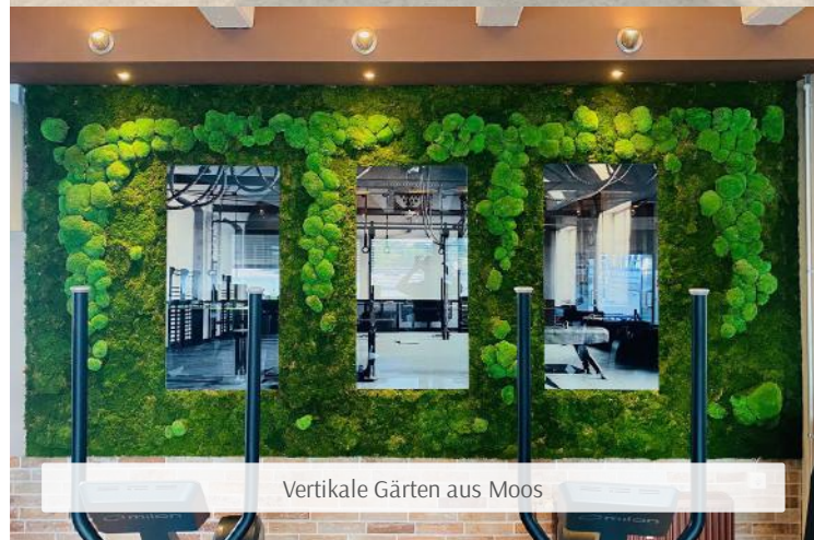
Vertikale Gärten aus Moos