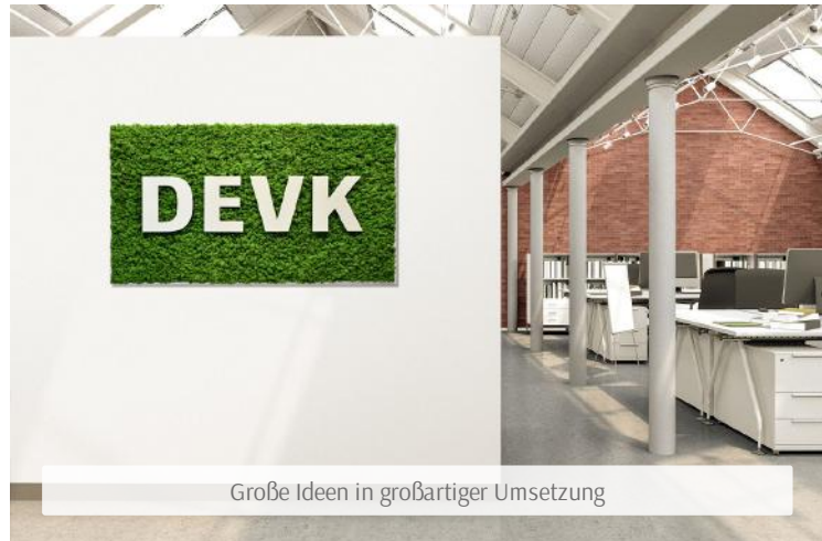
Große Ideen in großartiger Umsetzung