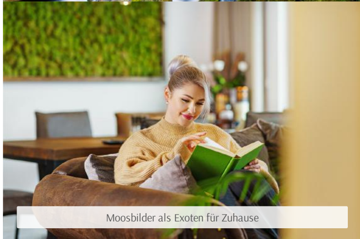
Moosbilder als Exoten für Zuhause

Sie benötigen ein DIY-Moosbild in besonderen Maßen?