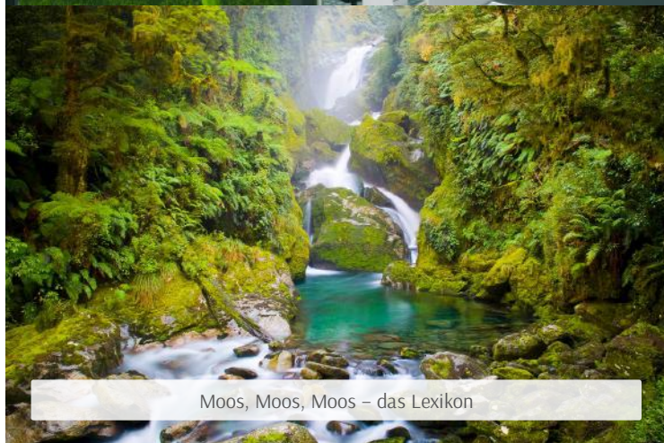
Moos, Moos, Moos – das Lexikon